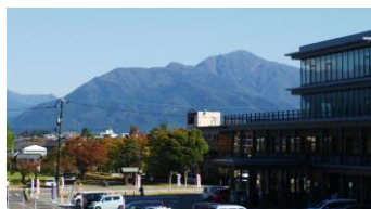
百名山の一つの荒島岳