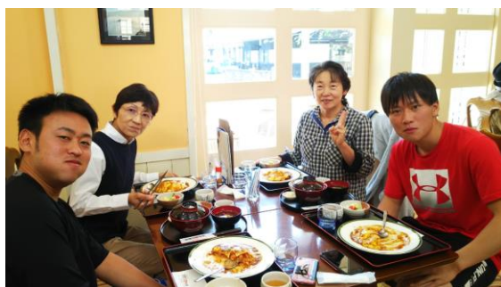
山内のオバちゃんの友達と4人で

▼大野市内の平成大野屋で昼食 (2018.10.21) ▼大野市内の平成大野屋前で