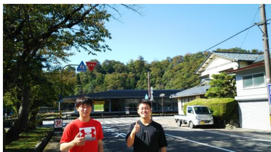
越前大野城は、天空の城で有名