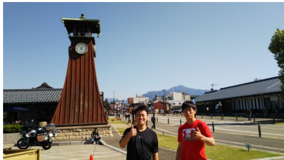
雲一つない晴天 ♥ 気持ちいい〜