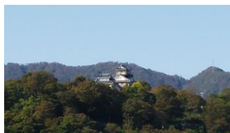
天空の城で有名な、越前大野城