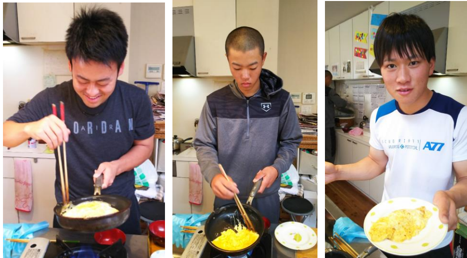
なかなか上手に作れました