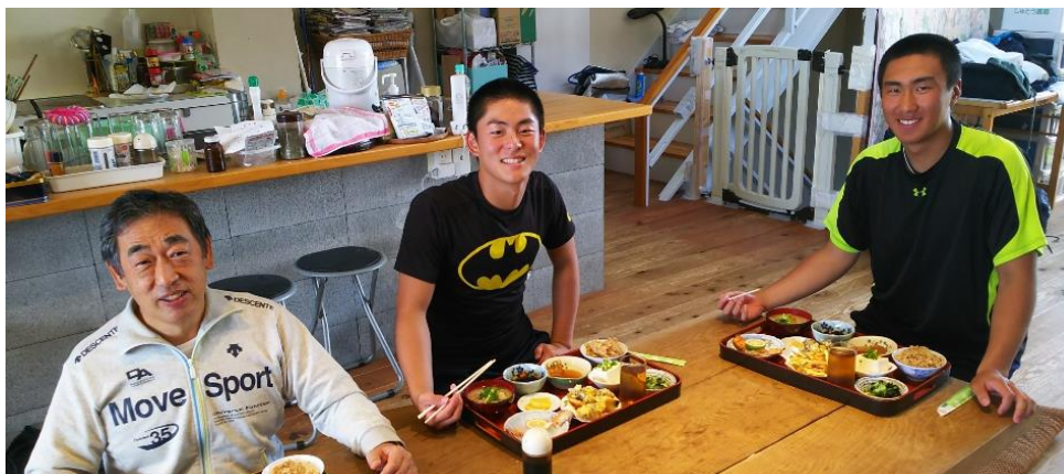
▼大野治療所3Fリビングにて晩ご飯 「豚の生姜焼き」 (2018.10.9)