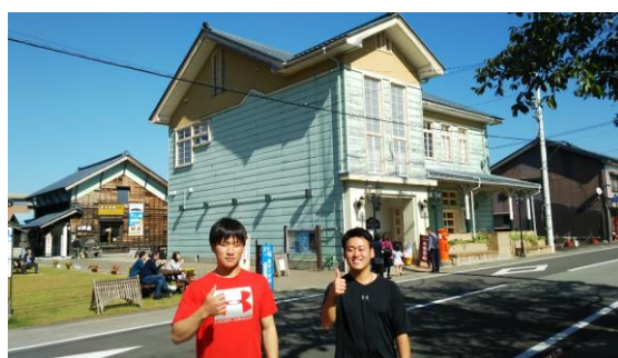
平成大野屋の建物は大正時代の建物をリフォーム